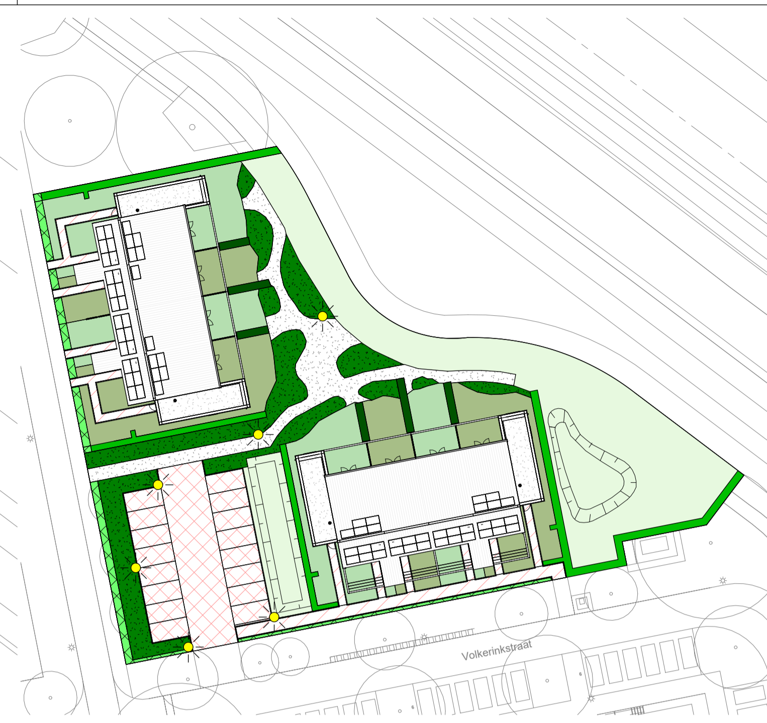
dakaanzicht schaal 1 : 500