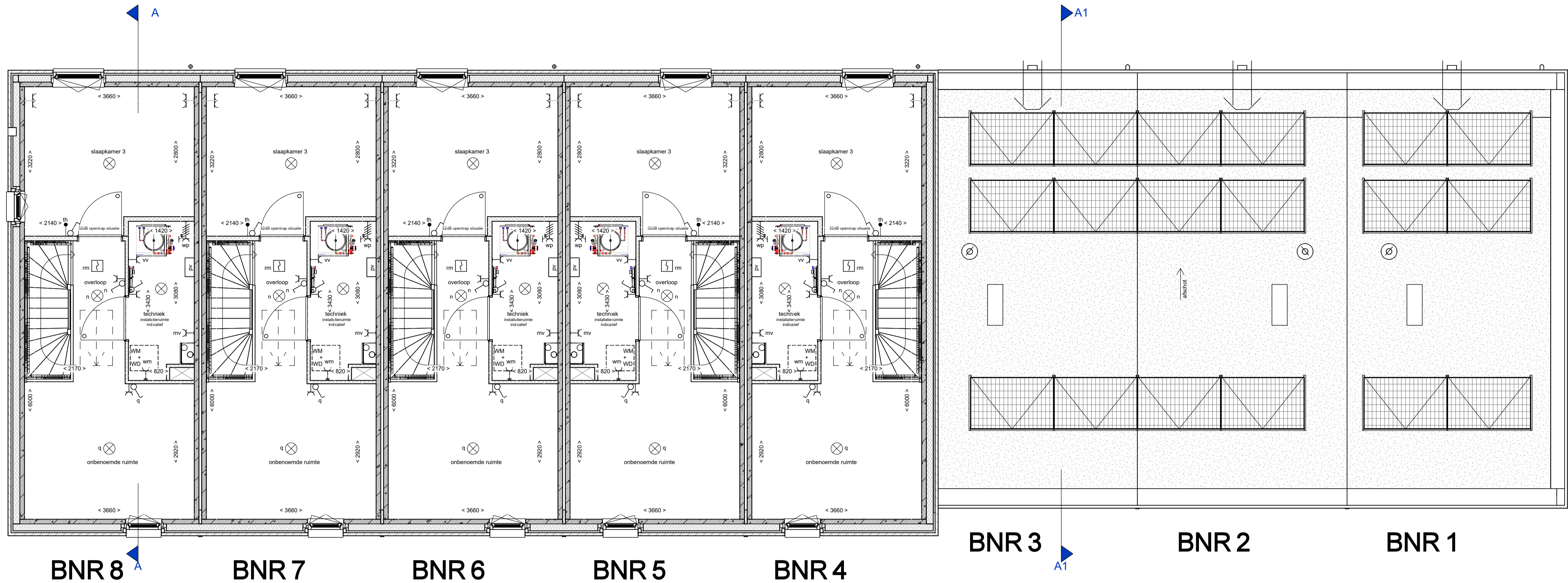
2e verdieping schaal 1 : 50